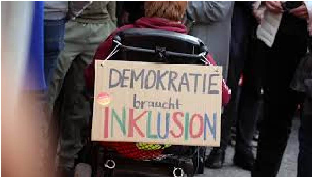
Demokratie braucht Inklusion

An der Behindertensession 2023 wurde eine Motion eingereicht, die für Menschen, welche unter einer Beistandschaft stehen uneingeschränkte politischen Rechte forderte, damit sie abstimmen und wählen können.