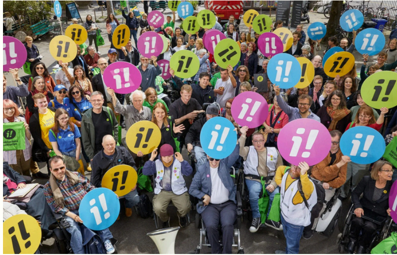
Start der Inklusionsinitiative im April 2023