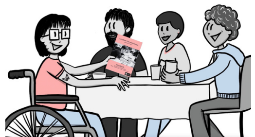
Illustration aus dem Film von Dana Rulf von Speakture