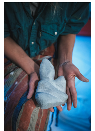
Bildhauen im Kleinformat