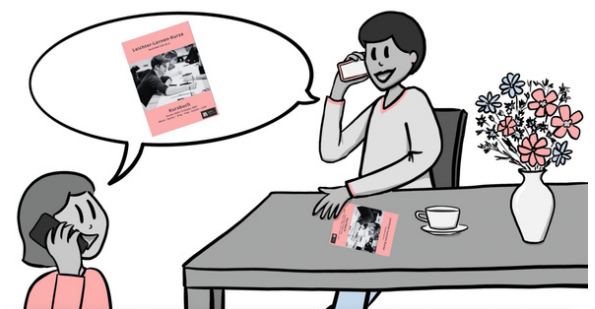
Illustration aus dem Film von Dana Rulf von Speakture