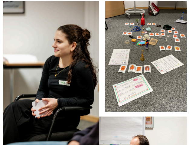
Einfühlsames Kommunizieren